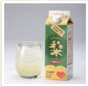
企業組合情熱市原ワンハート 「いちはら梨ベース」