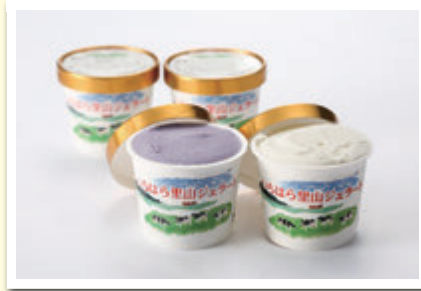
里山ファーム 「いちはら里山ジェラート」