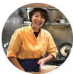
お姐さんが作る 美味しいラーメン 森田家

森田家は、創業60年のラーメンや甘味を提供する五井地区の飲食店。娘への事業引き継ぎを機に、屋号を以前の森田屋からアットホームなイメージの「森田家」に変更、合わせて女性や家族連れが入店しやすい看板の設置とフェイスブックページを立ち上げました。 また、店舗近くのヨーカドー跡地にマンションや福祉施設の開発が進行中であり、本年10月の消費税増税にもならみ、メニューの改定も行い、近隣ホテルへの営業を初めて実施しました。 この店舗改装事業によって、前年同月と比べ平均して来客数が30人以上増加、新規客は平均5名ずつ増加、売上は108%を達成しました。今後においても、新たな顧客を呼び込むため、女性やシニア向けに情報発信をしていきます。