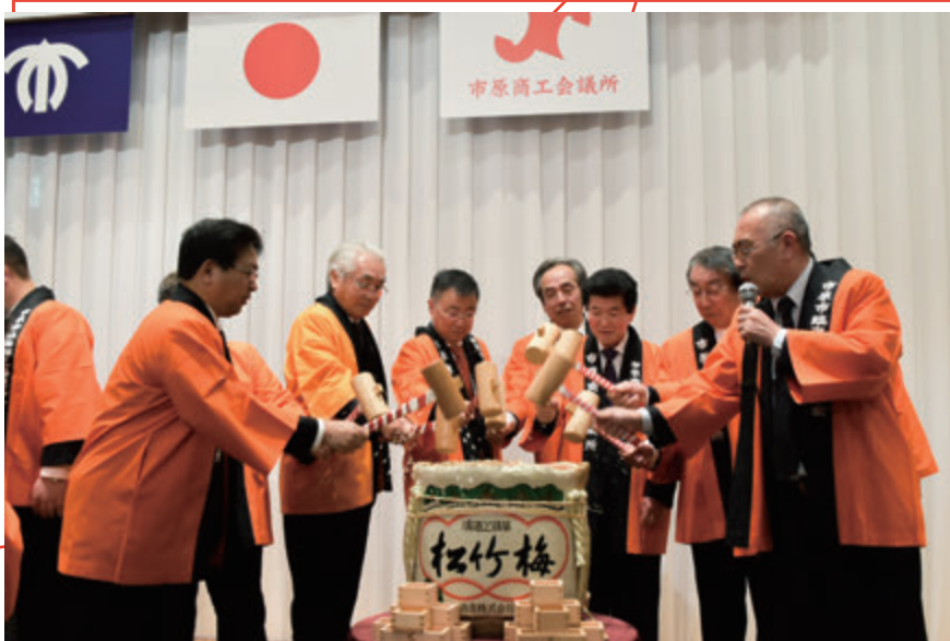
平成31年新春賀詞交歓会 鏡開き