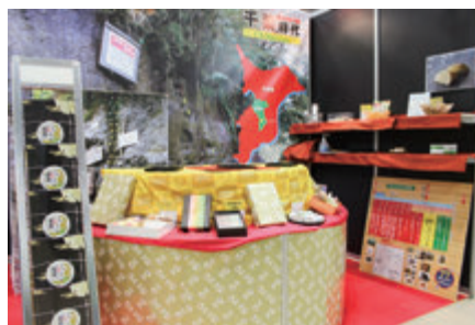
昨年の市原商工会議所 ブース

見学ご希望の方は 招待状を送付致します。 市原商工会議所まで お電話ください。 TEL 0436-22-4305