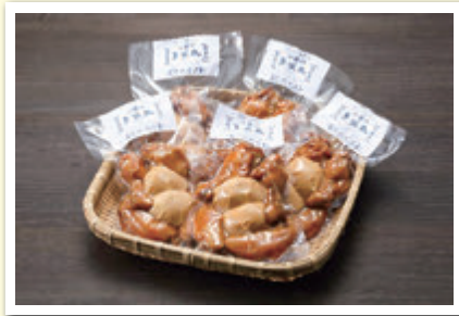
(有)時田商店 「鶏手羽の旨煮」