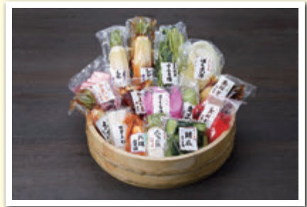
(有)吉野商店 「よしの漬物」