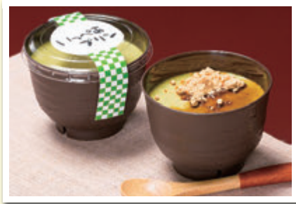
渓谷どつとねっと 「いっぺあプリン」